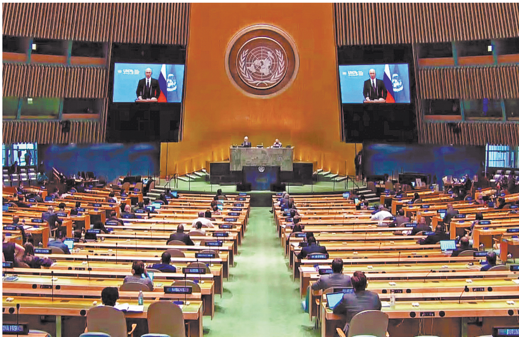
Выступление Владимира Путина на Генассамблее ООН было записано заранее и длилось около 20 минут.